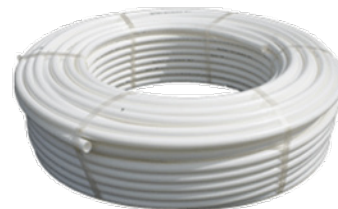
Neotherm PE-RT Rør